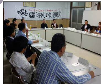
第2回京都「おやじの会」連絡会の様子 (平成26年5月23日)